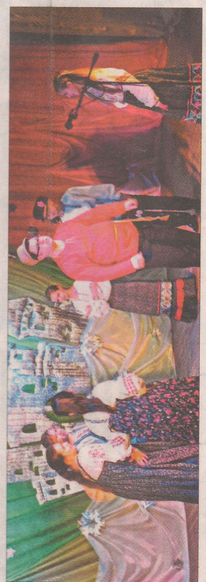
В начале тренинга перед гостями выступили школьные творческие коллективы.